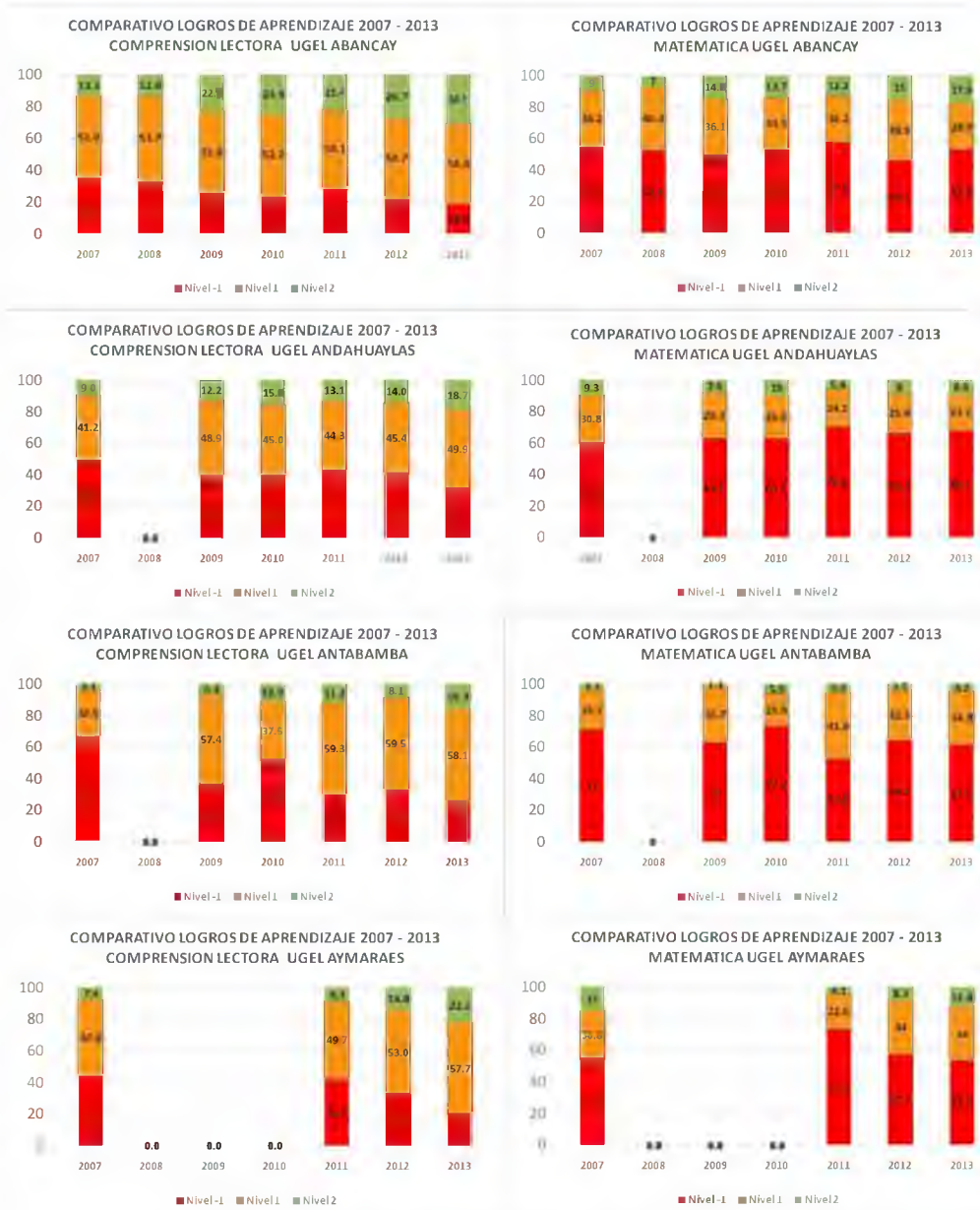
GRAFICO 2 2 :