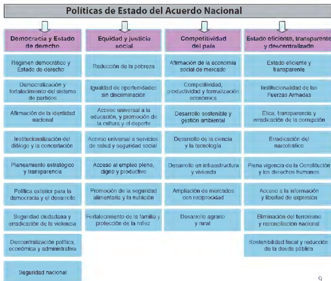
Grafico Nro. 1

Dentro del sector educación CPLAN plantea como una política de estado del Acuerdo Nacional el “Acceso universal a la educación y promoción de la cultura y el deporte;